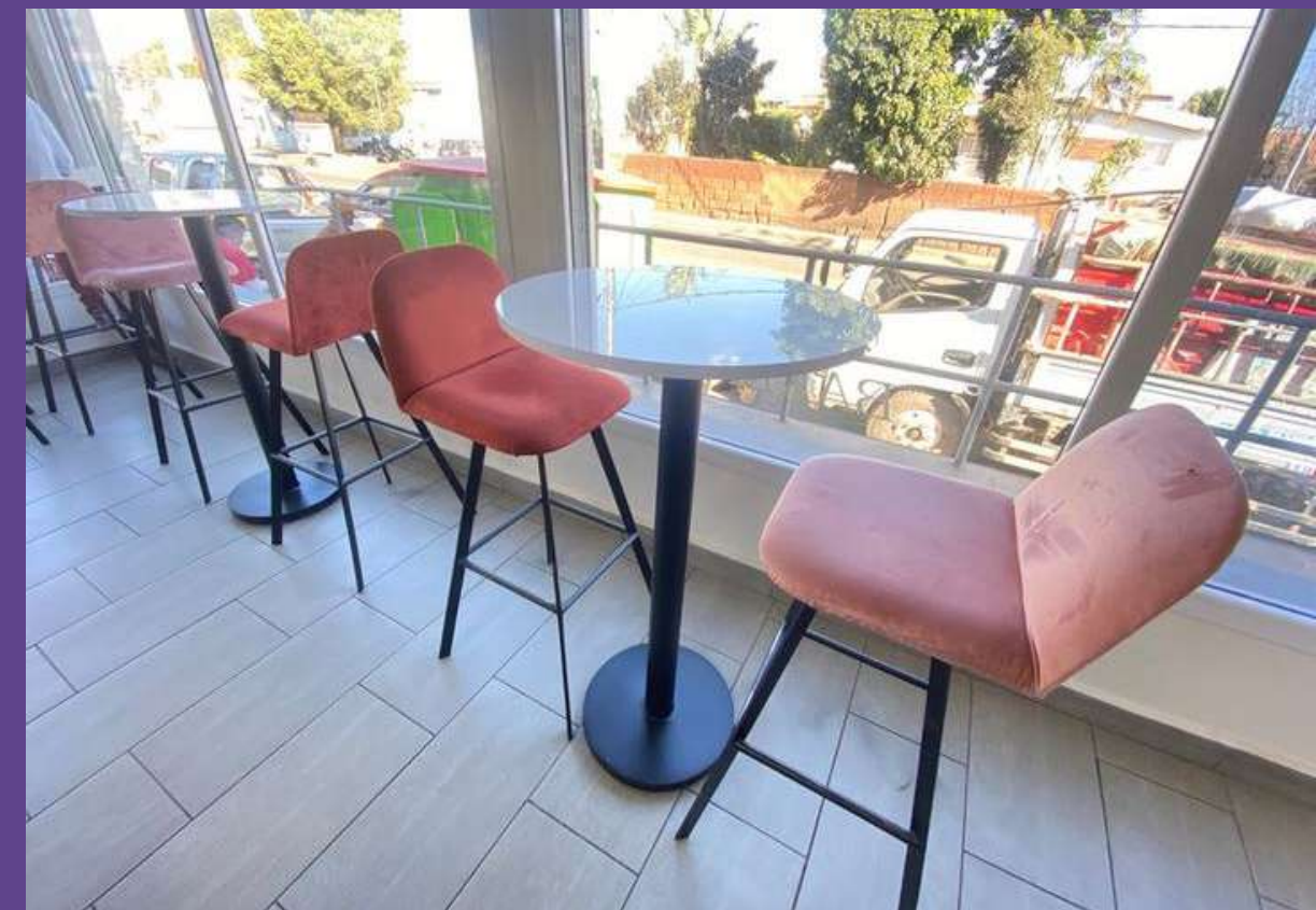
Aménagement boutique - Galana Coliseum - 2024