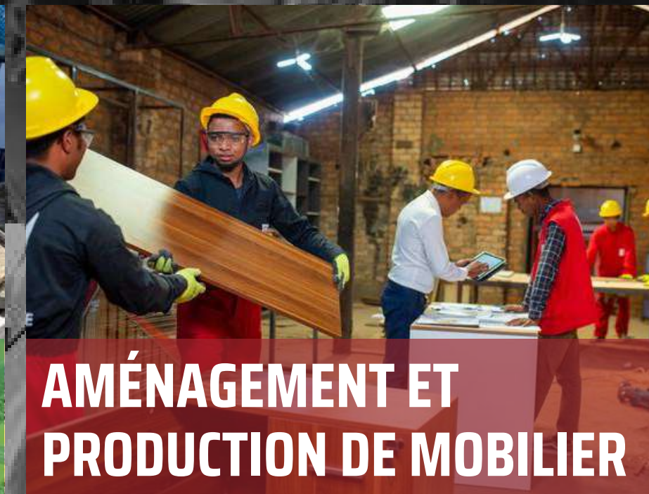
AMÉNAGEMENT ET PRODUCTION DE MOBILIER