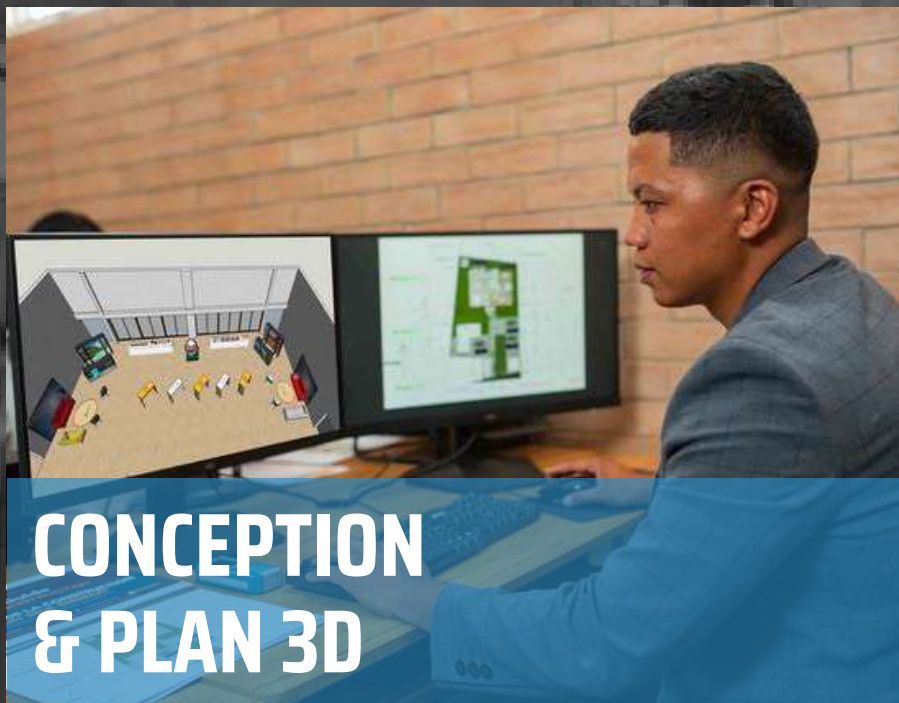
CONCEPTION & PLAN 3D