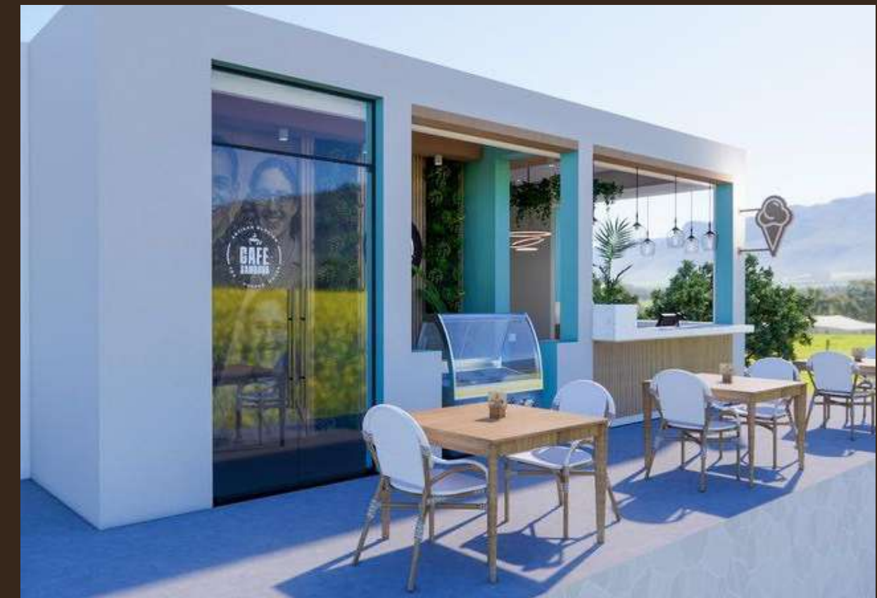
Vanilleraie Nosy Be - Petit Salon 3D