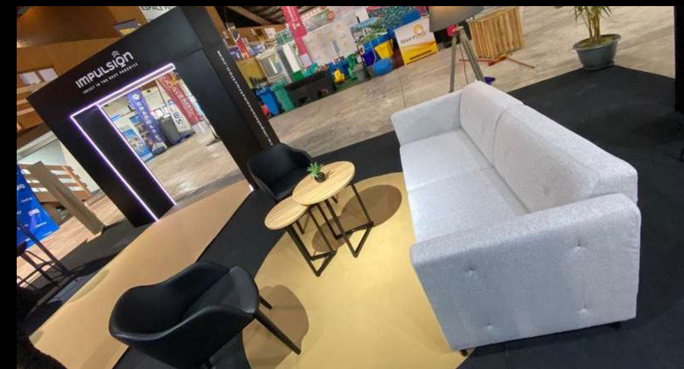
Impulsion - Salon International de l'Habitat 2024