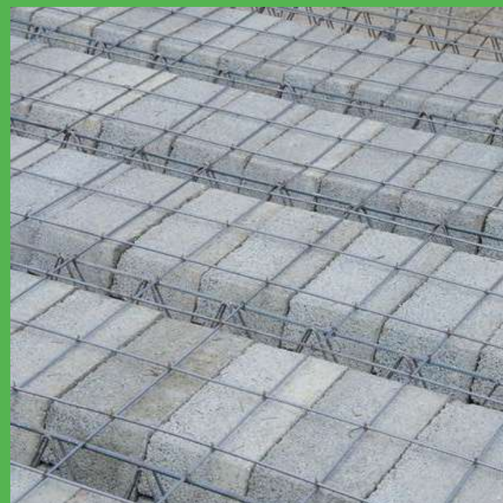
Installation des poutrelles, hourdis et ferrailage dalle de compression