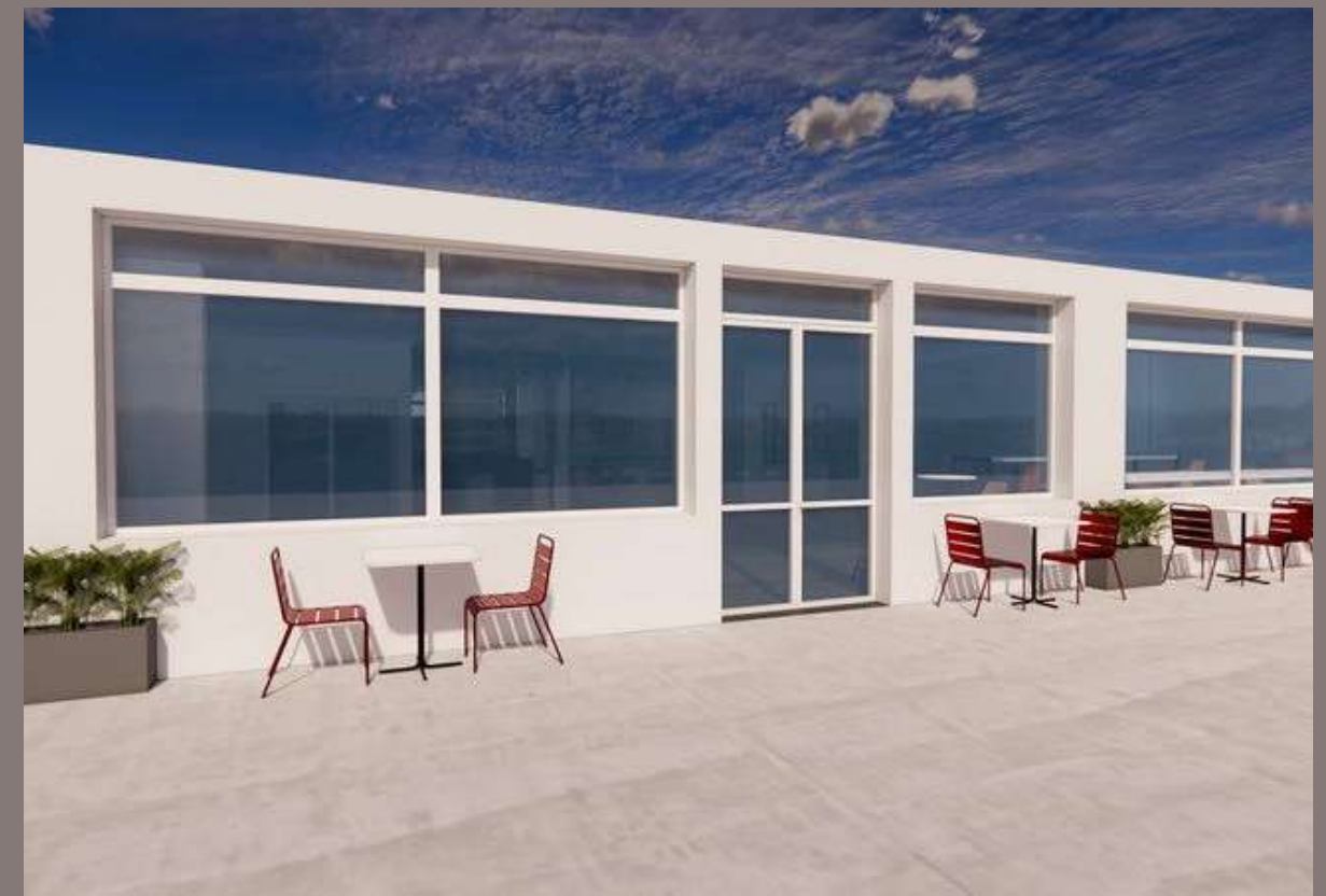
Fourniture de mobilier - Galana Sabotsy Namehana - 2025