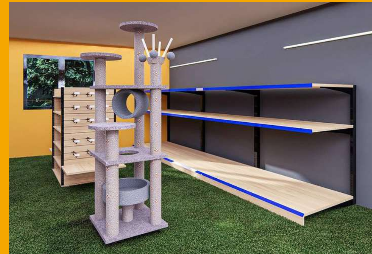
Aménagement boutique - DOGS & CO - 2014