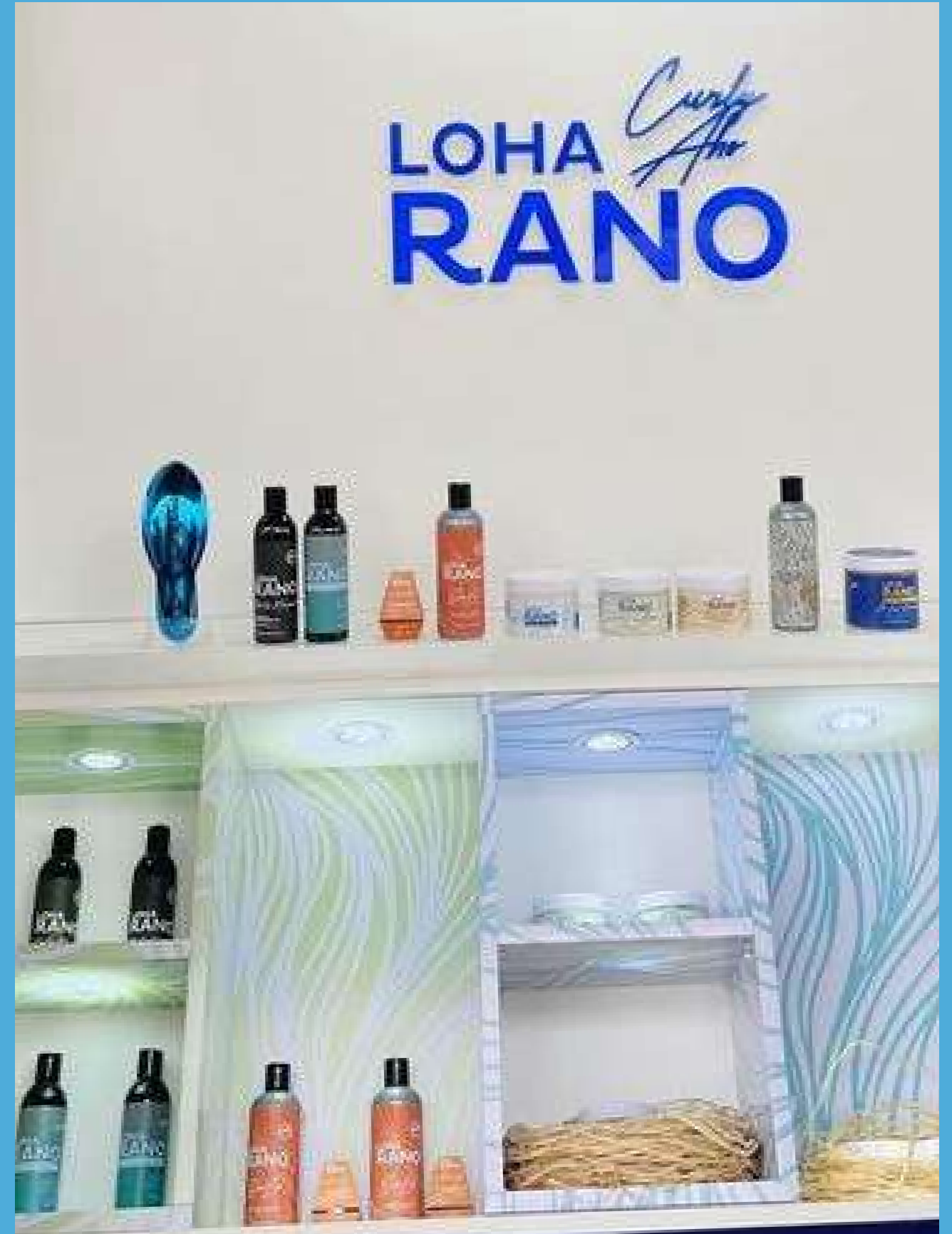
Stand CURLY AHO