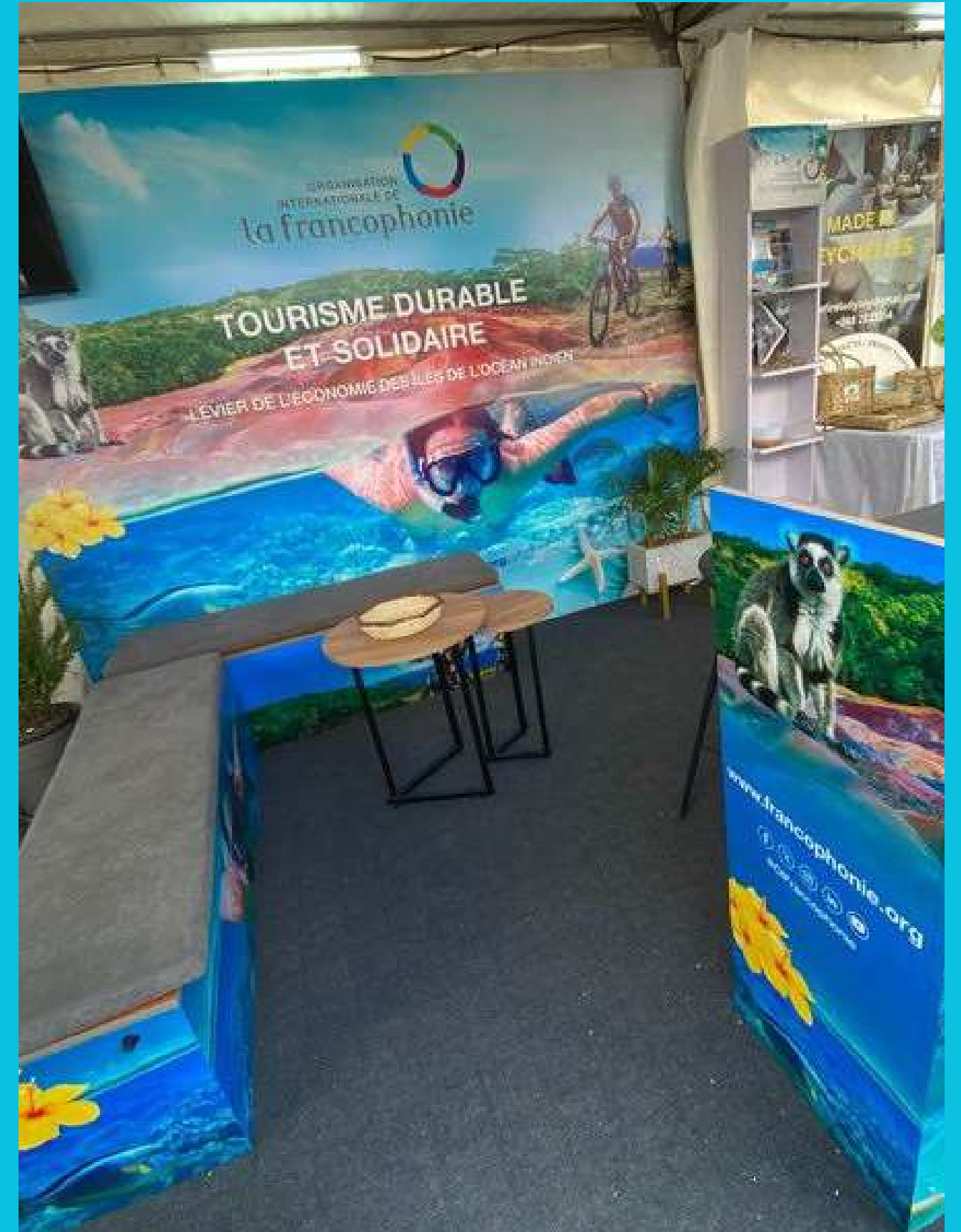
Stand OIF - ITM 2024