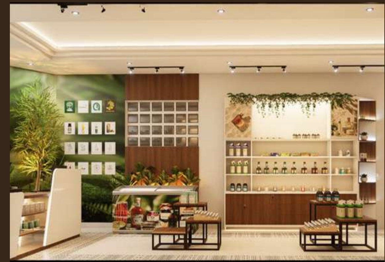
PFE - Boutique cosmétique made in Madagascar - Colisée