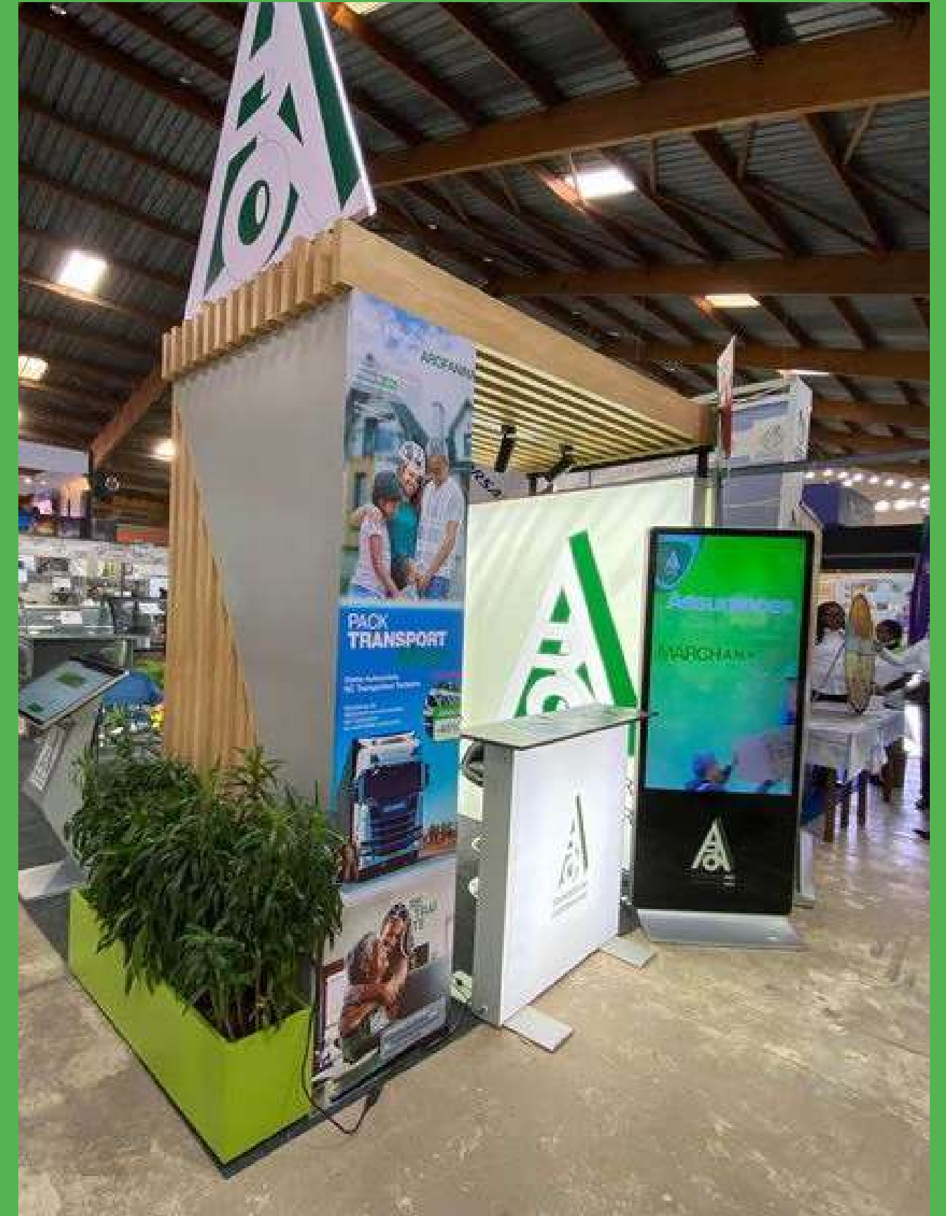
Stand ARO - FIM 2024