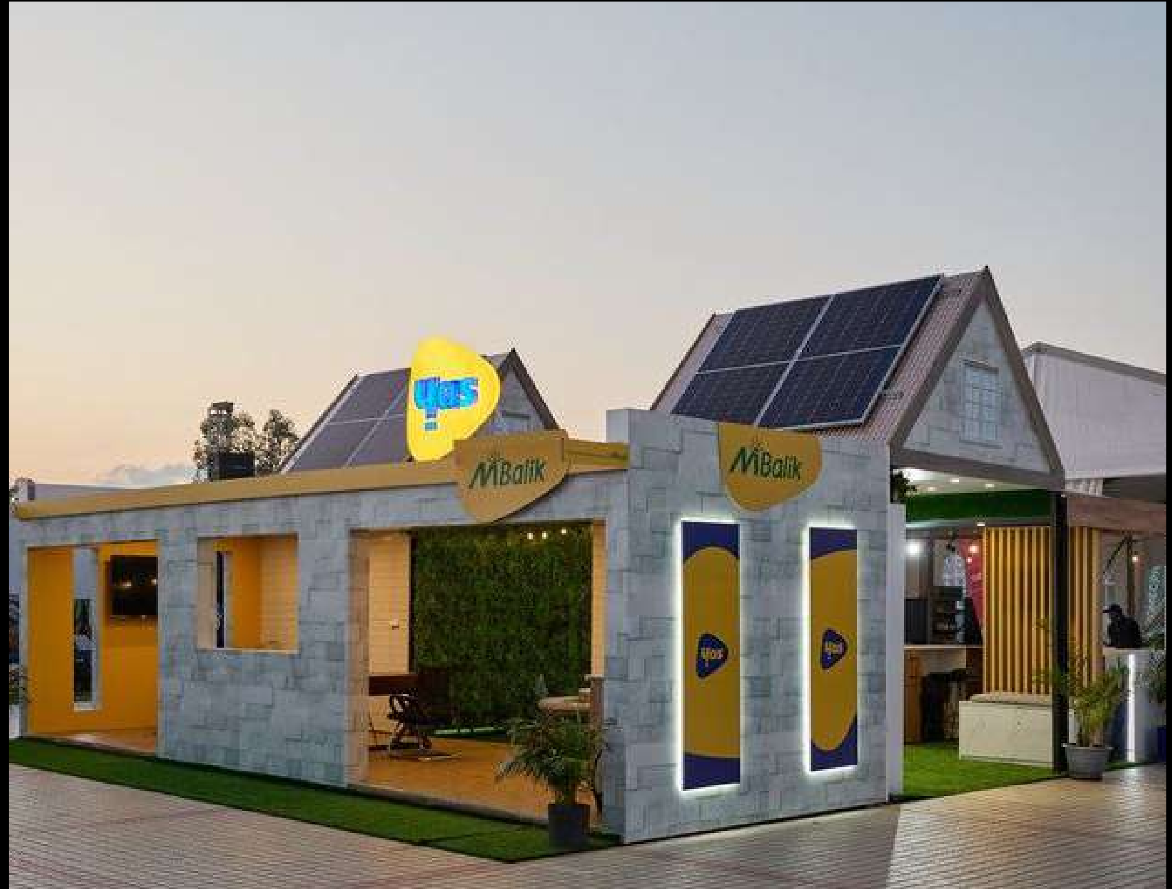
YAS - FIA CCI Ivato 2025