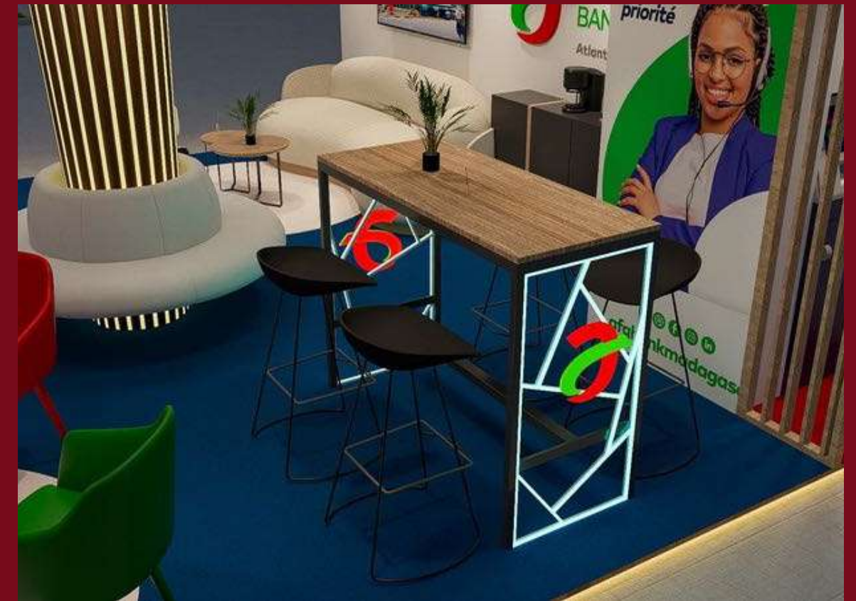
CONCEPT STAND AFG 2025