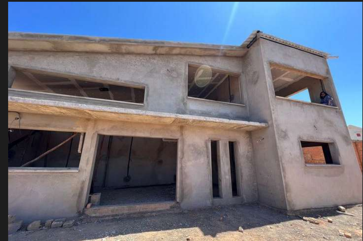
Construction villa clé en main - Manazary Ilafy