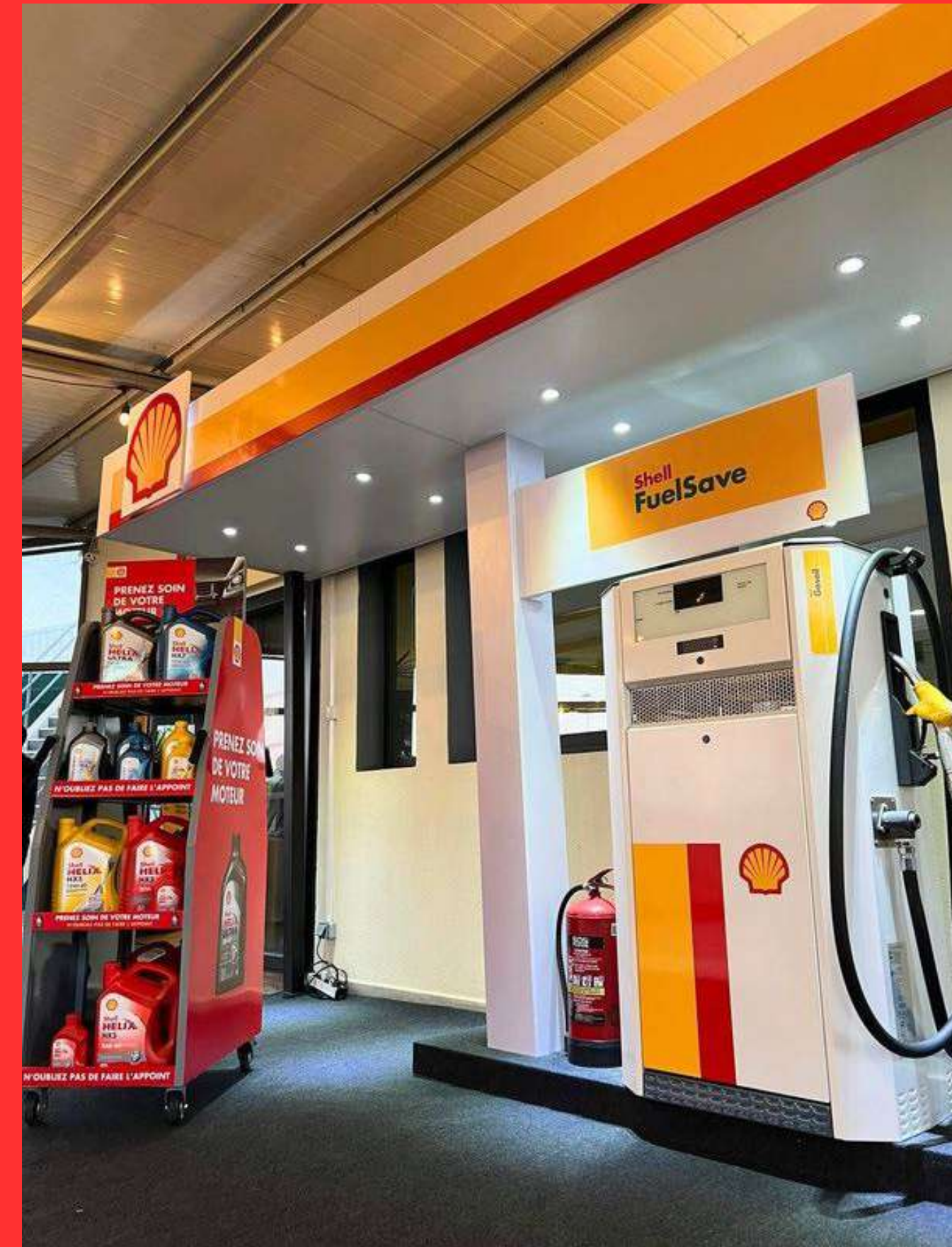
Stand SHELL - WORKSHOP 2024