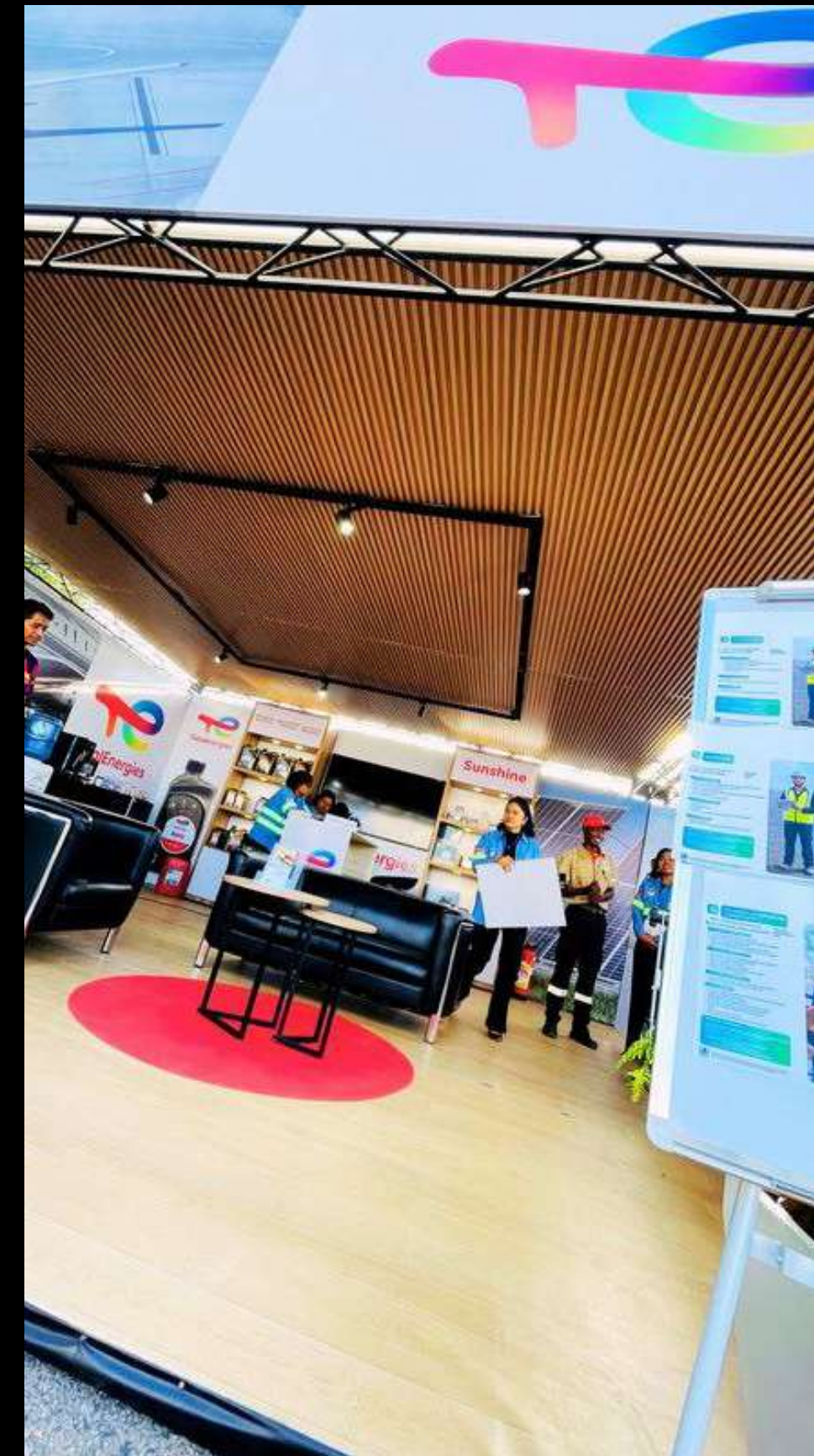
TotalEnergies - Aéro Expo 2026