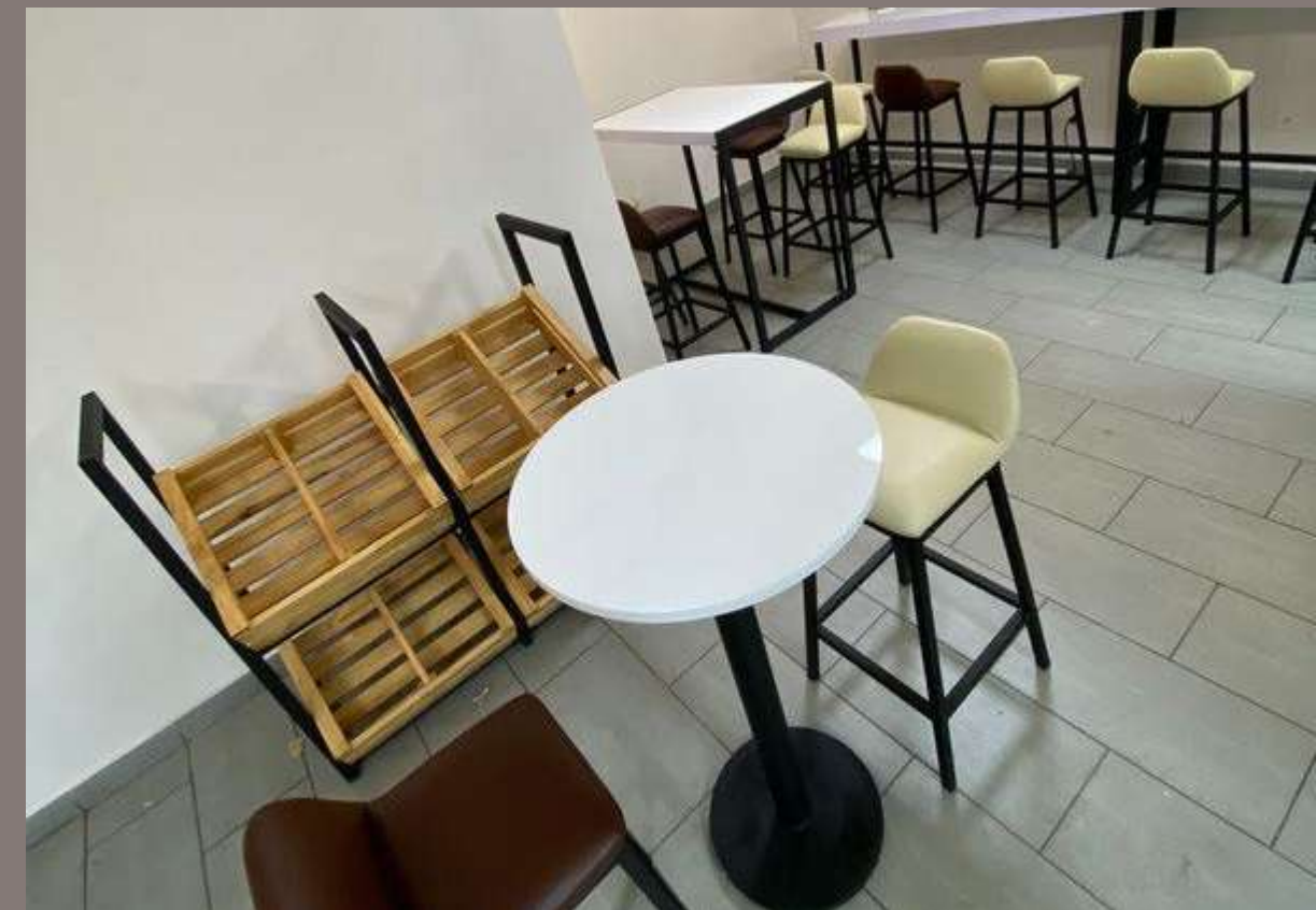
Fourniture de mobilier - Galana Sabotsy Namehana - 2025