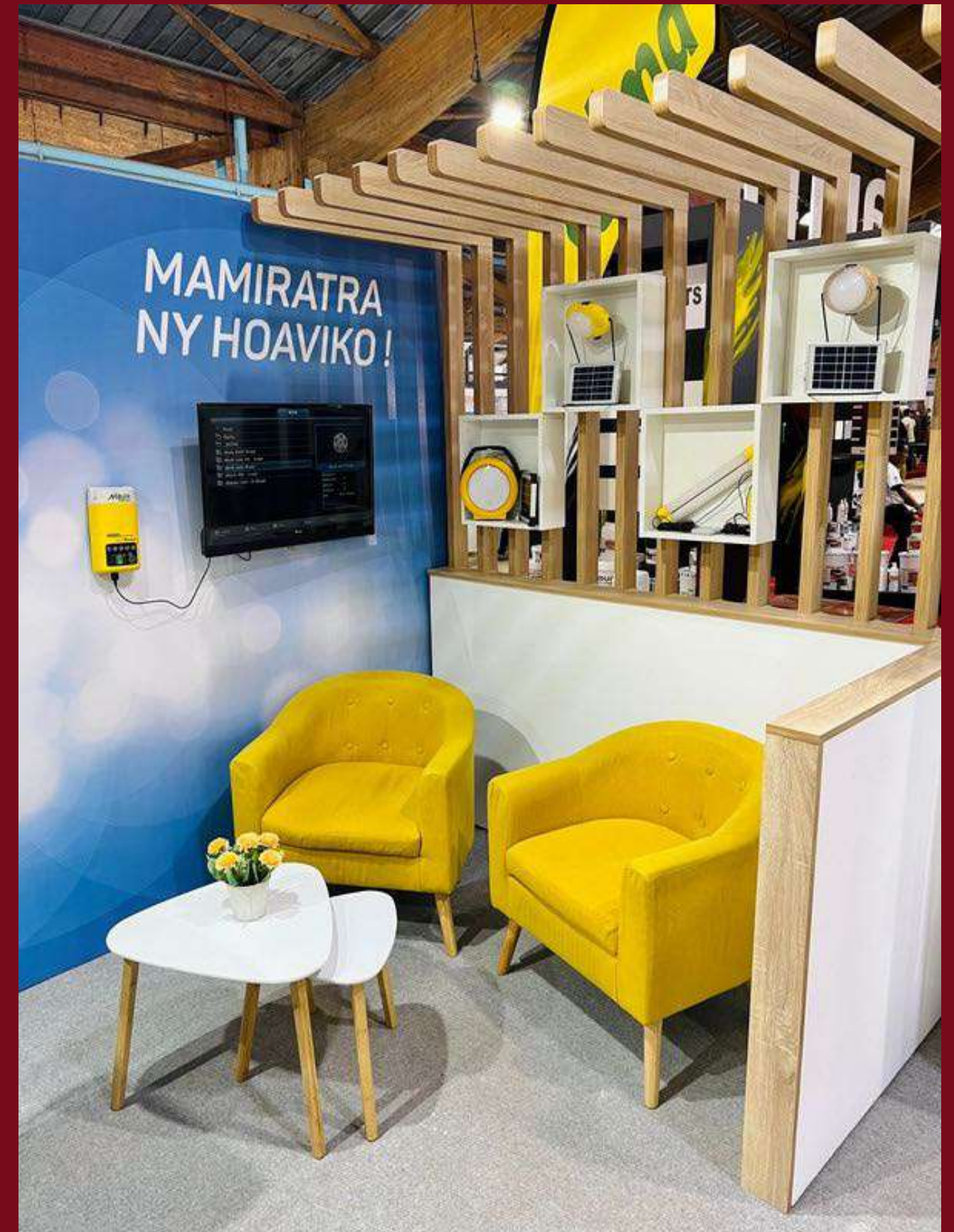
Stand Telma - Mbalik - Salon International de l'Habitat 2023