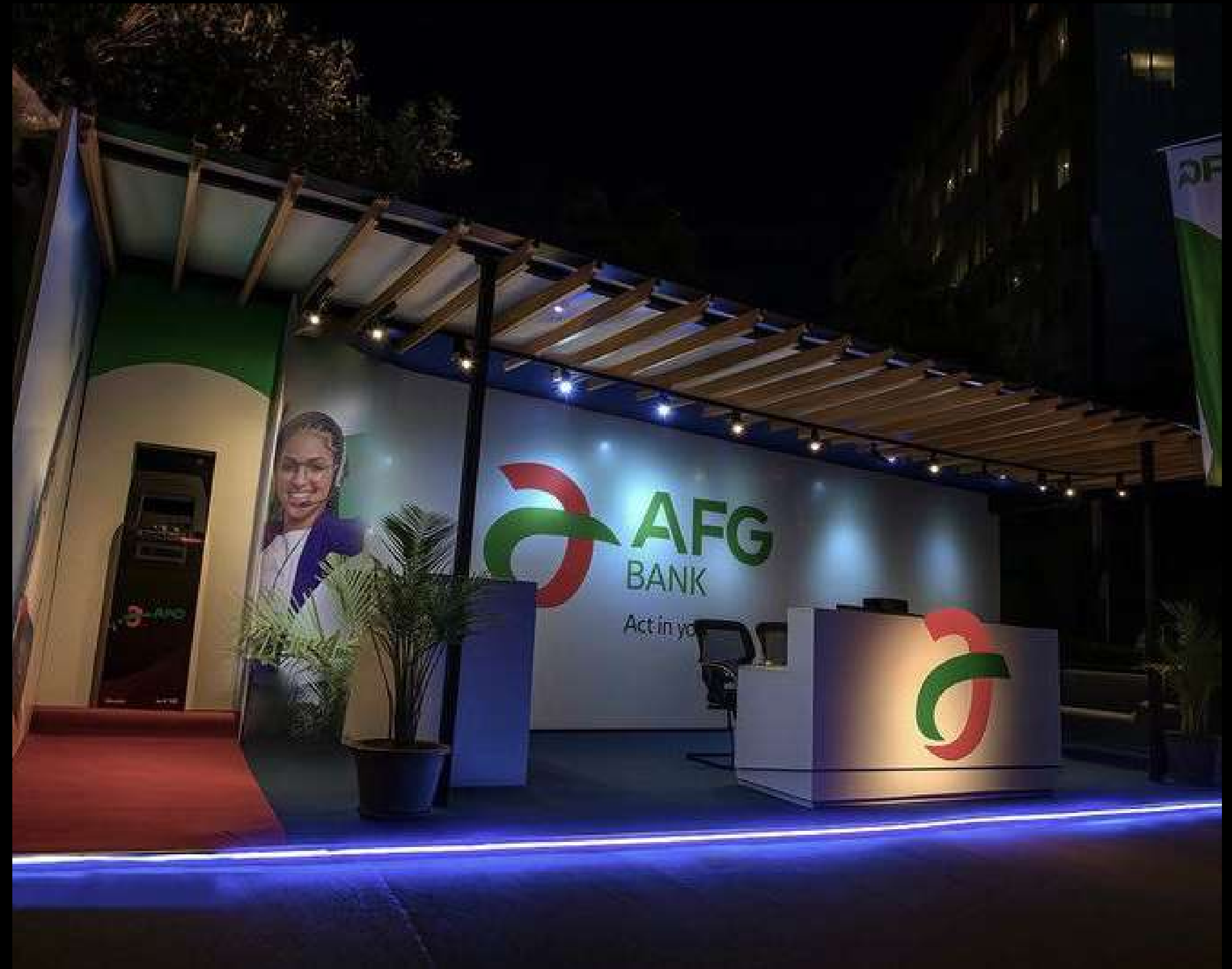
AFG Bank - SADC Novotel 2025