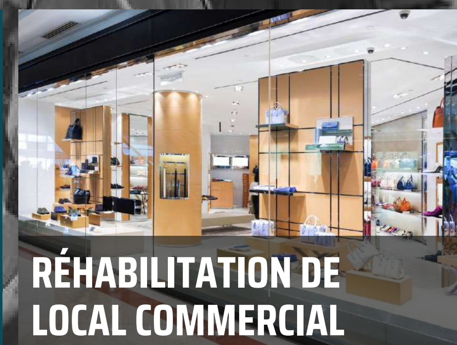
RÉHABILITATION DE LOCAL COMMERCIAL

Pour toute demande de devis, veuillez contacter notre service commercial