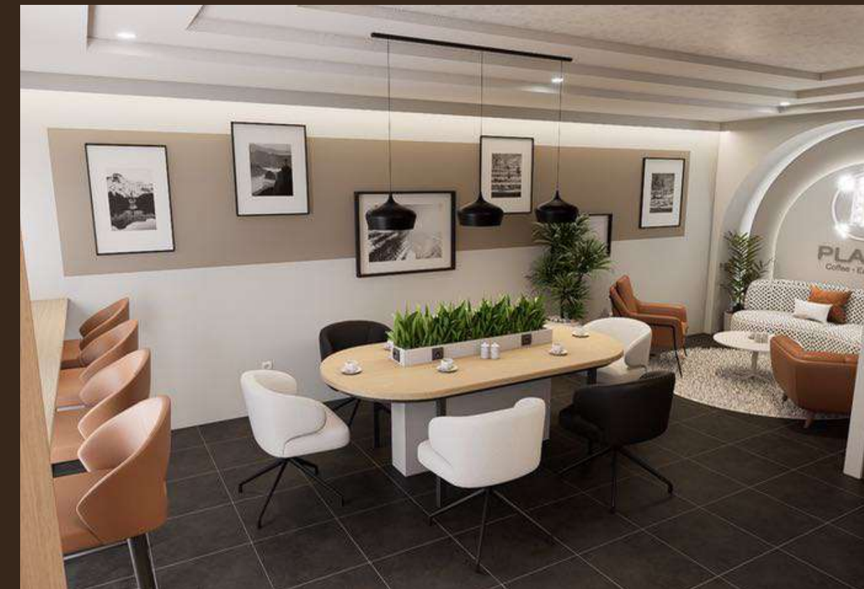
Aménagement 3D - PLAN B Tana Water Front Ambodivoana