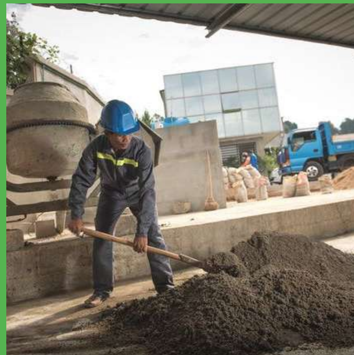
Phase de préparation (dosage, mélange ...)