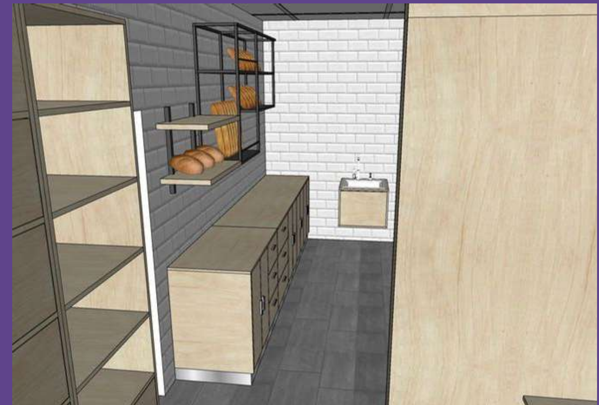
Aménagement boutique - Galana Coliseum - 2024