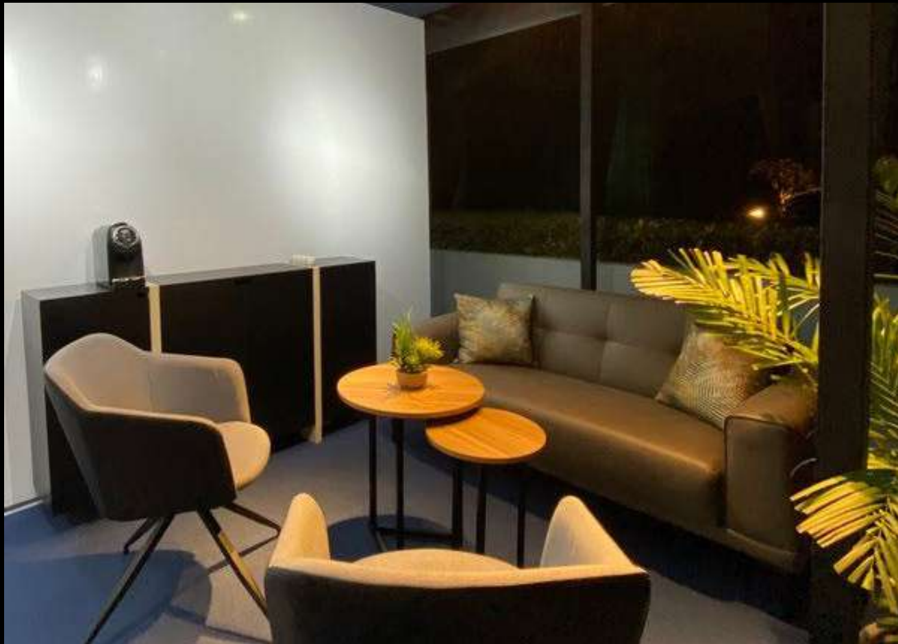
AFG Bank - SADC Novotel 2025