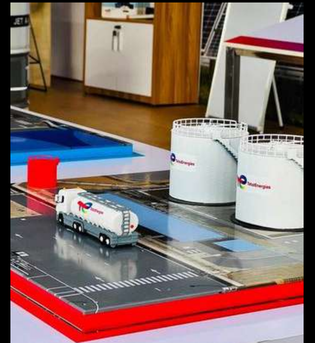
TotalEnergies - Aéro Expo 2026