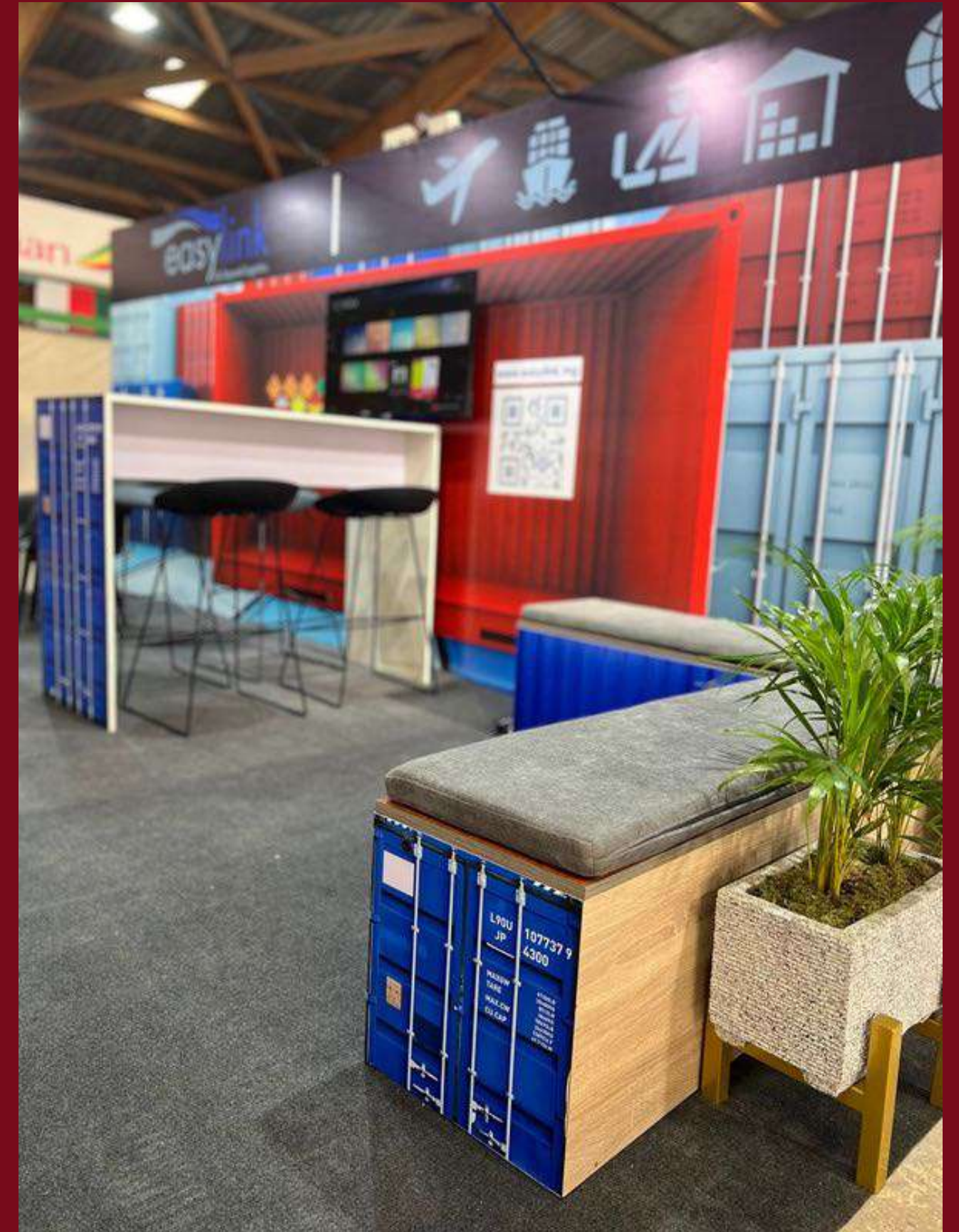
Stand EASYLINK - SITLM 2024