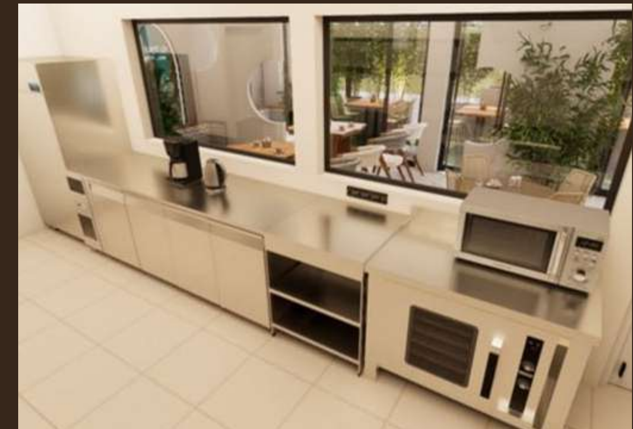
Proposition de concept de Restaurant - Salon de thé - Toamasina