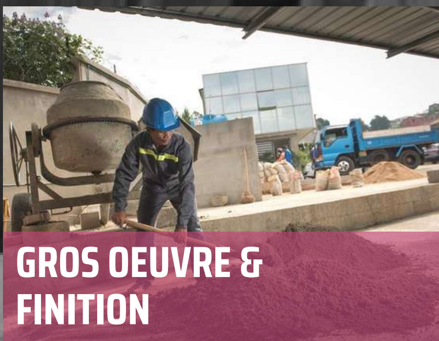
GROS OEUVRE & FINITION