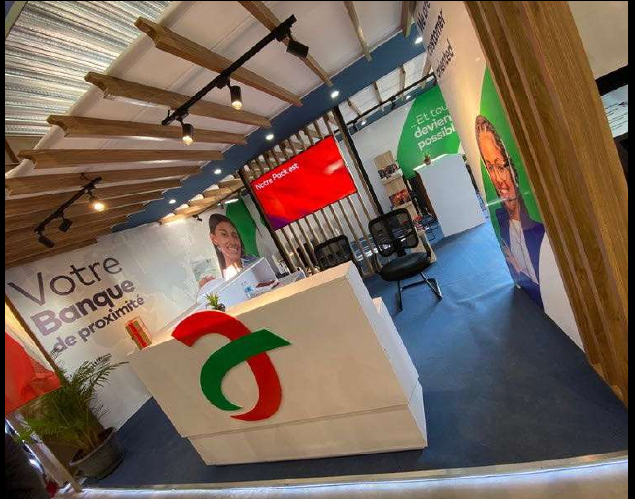
AFG Bank - SADC Enara 2025