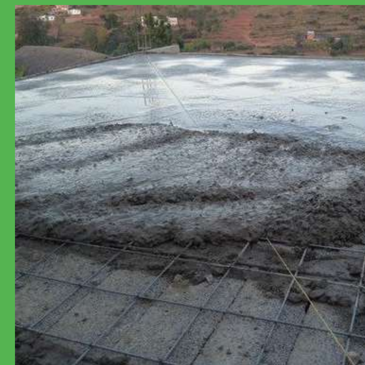
Coulage béton dalle de compression et nervure