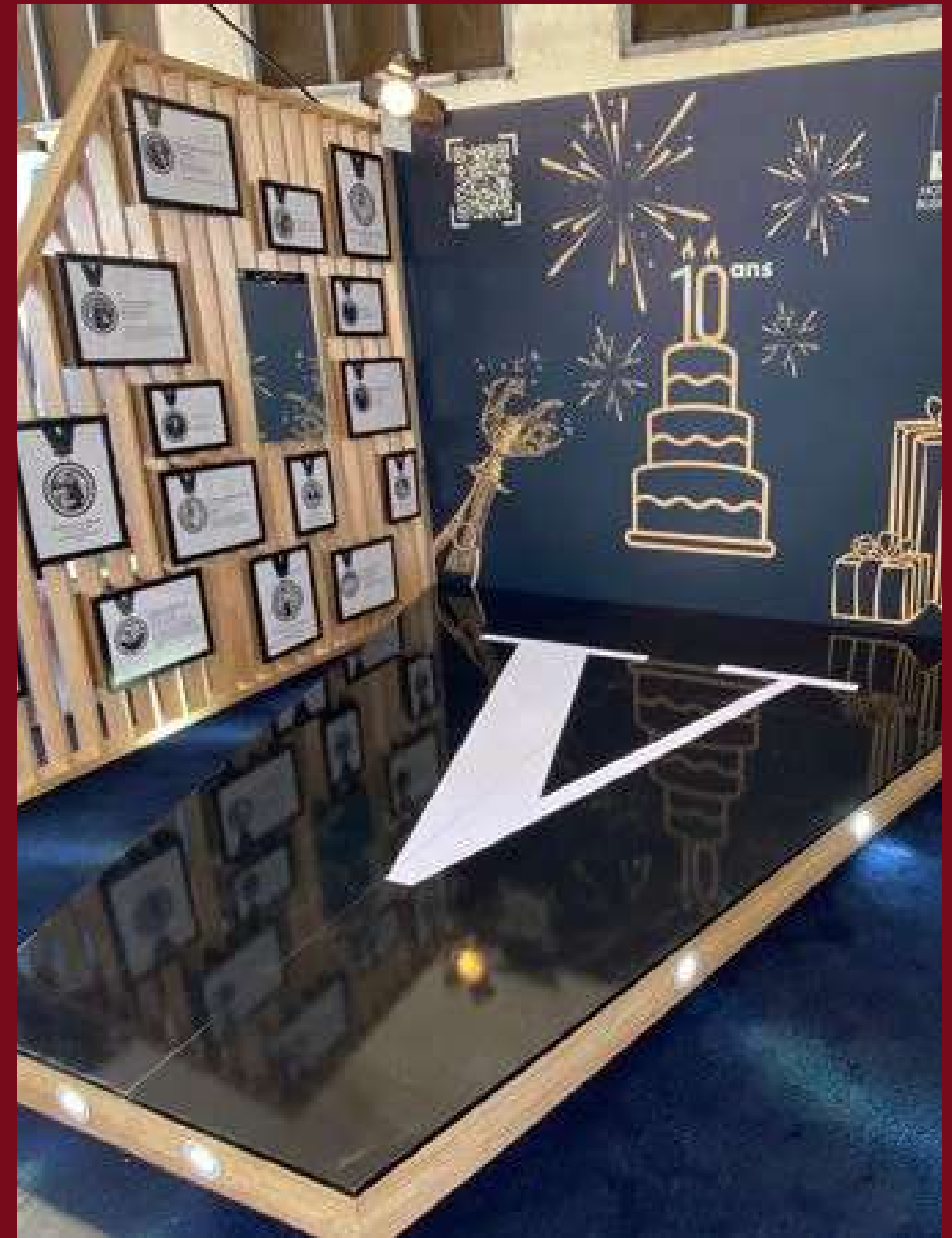
Réalisation Stand Vatel - 2024