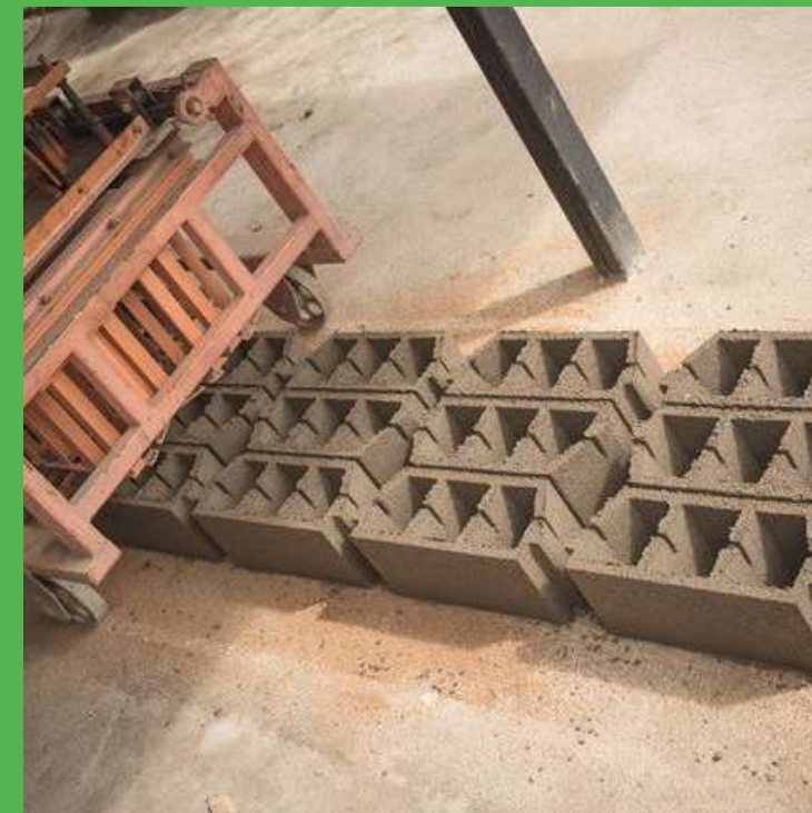
Phase de moulage sous pression avec machine à vibration