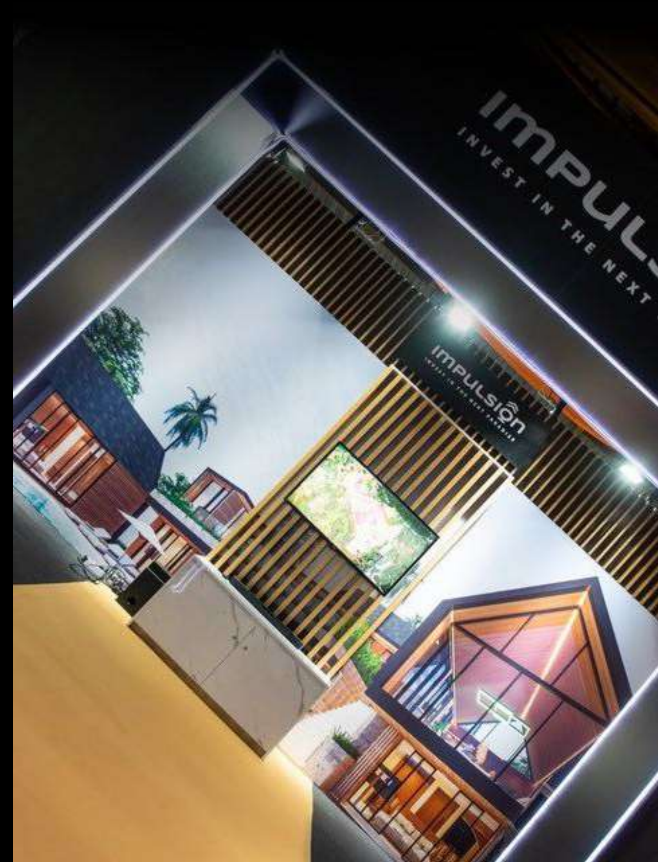
Impulsion - Salon International de l'Habitat 2024