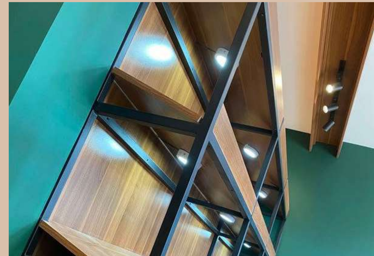
Aménagement boutique - SARADDEX - 2025