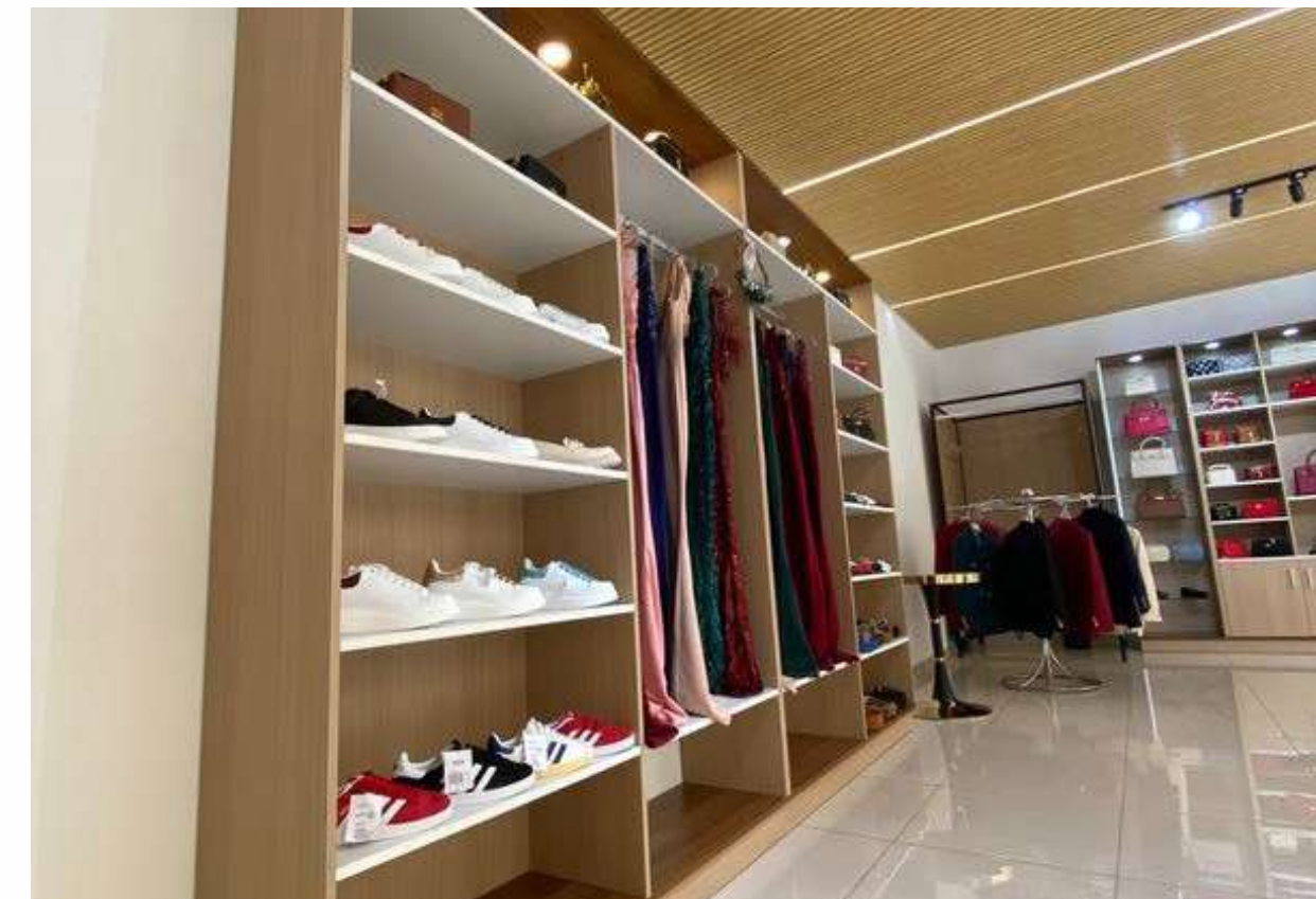
Aménagement boutique - Ivato - 2026