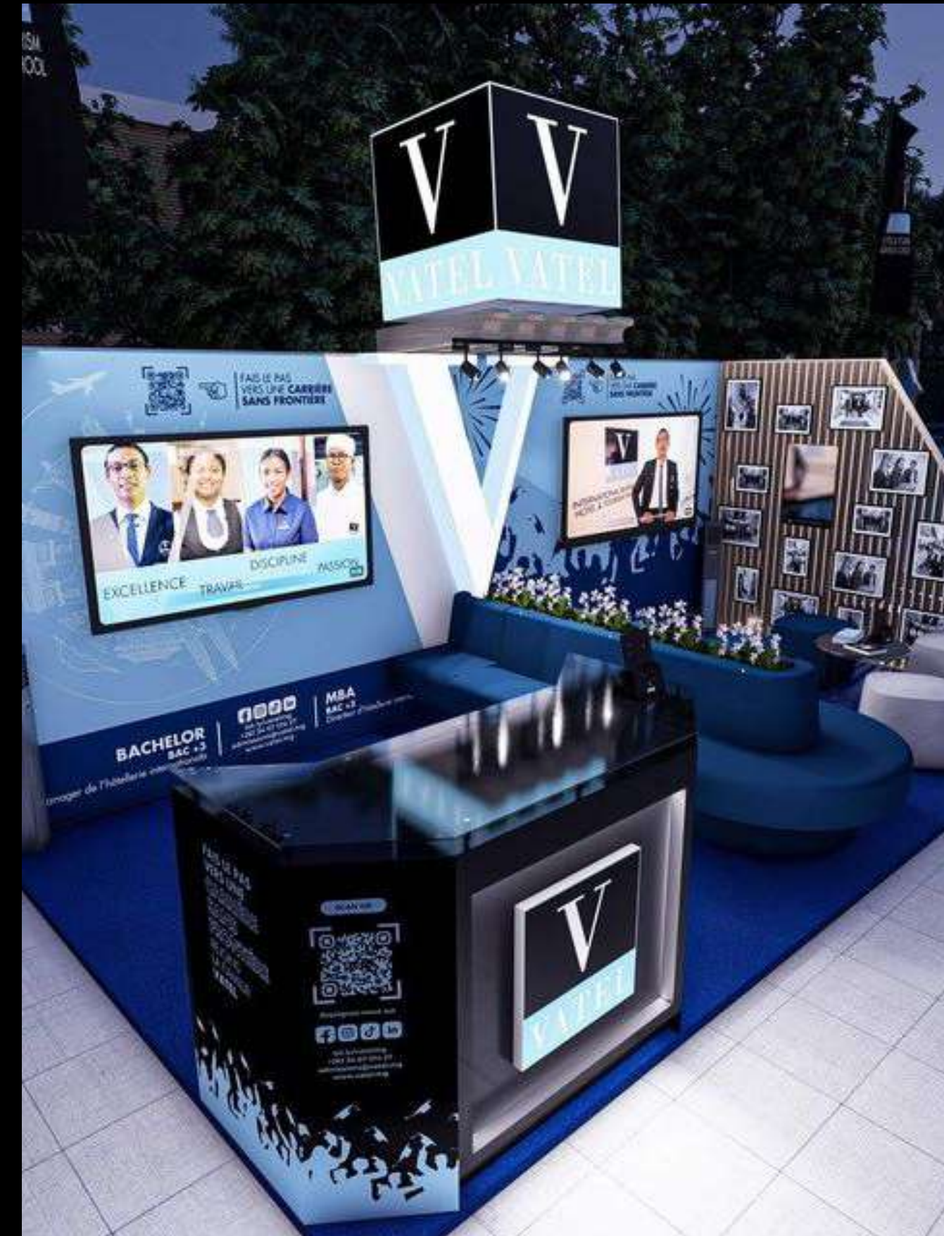
Simulation 3D Stand Vatel - 2024