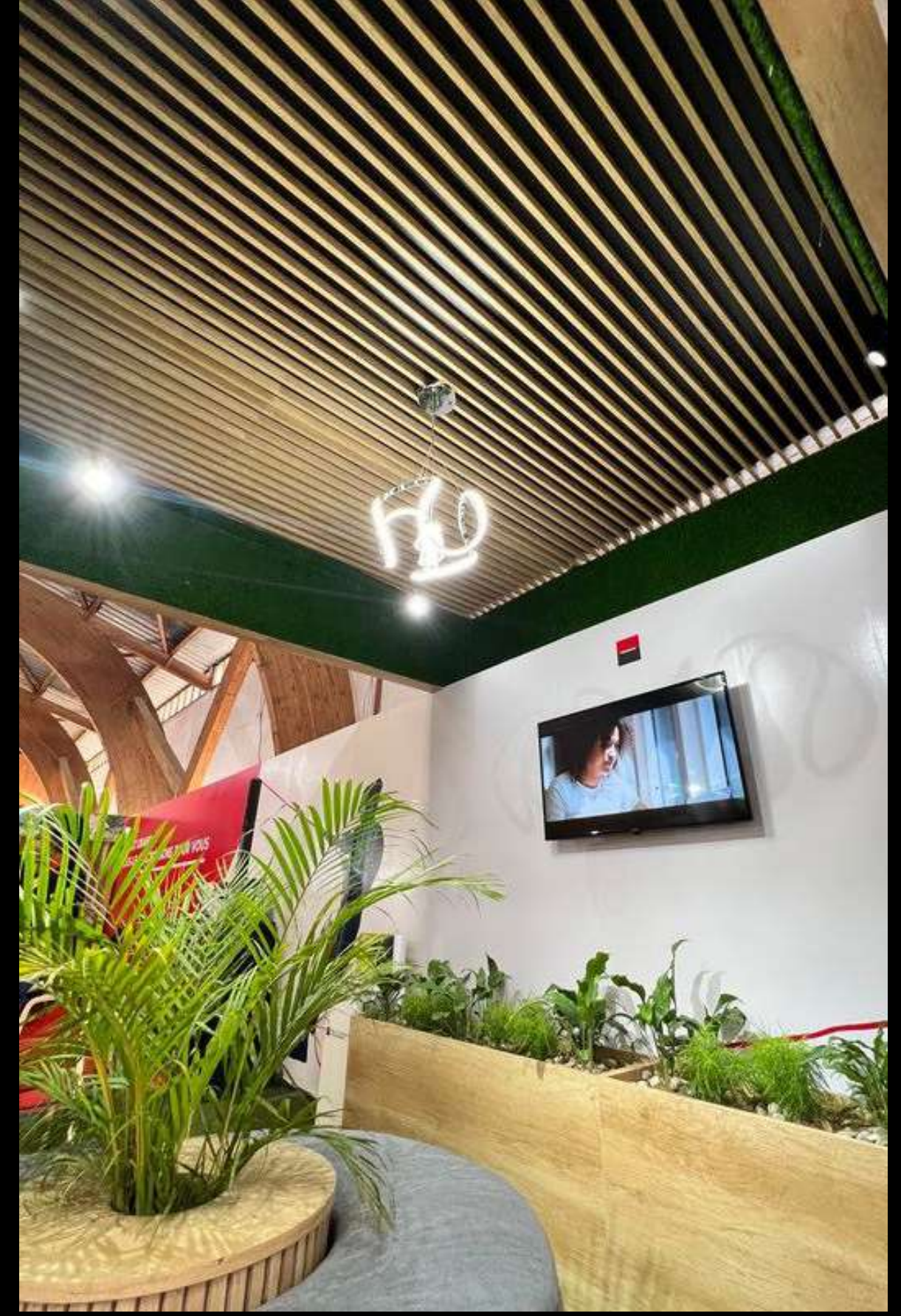
Stand SG-Mada-SIH 2024