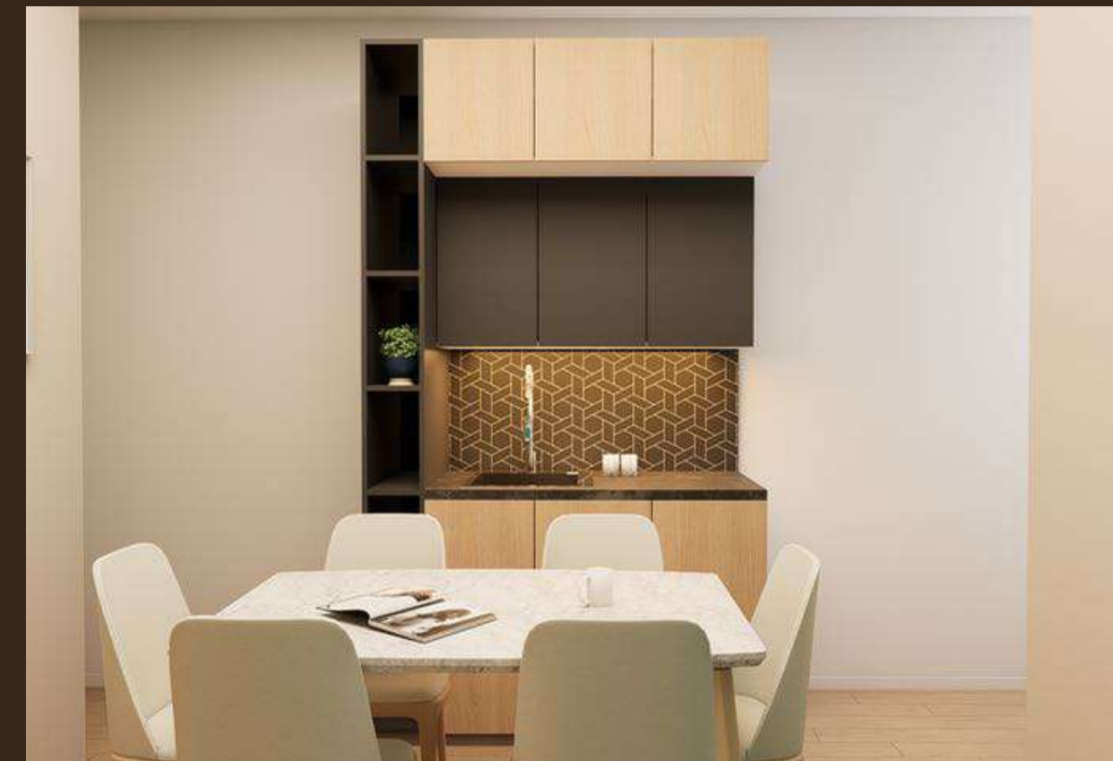
Salle du personnel - Ambassade de Fance