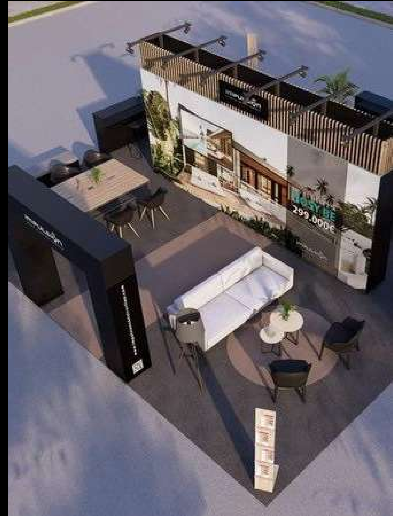
Impulsion - Salon International de l'Habitat 2024