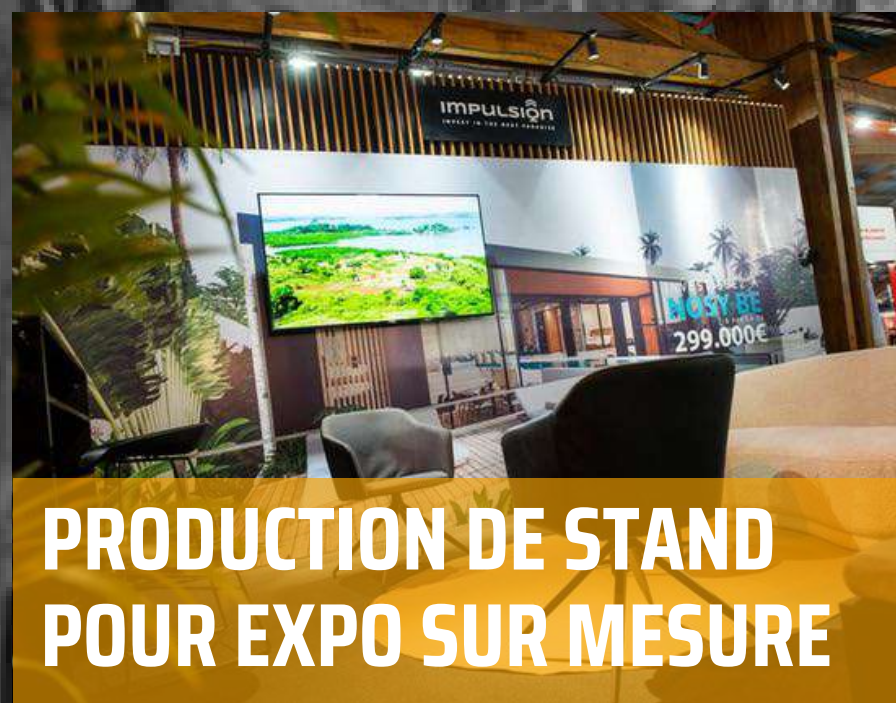
PRODUCTION DE STAND POUR EXPO SUR MESURE