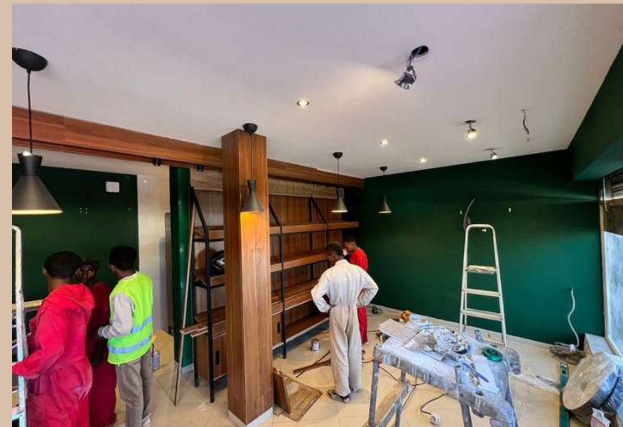
Aménagement boutique - SARADEx - 2025