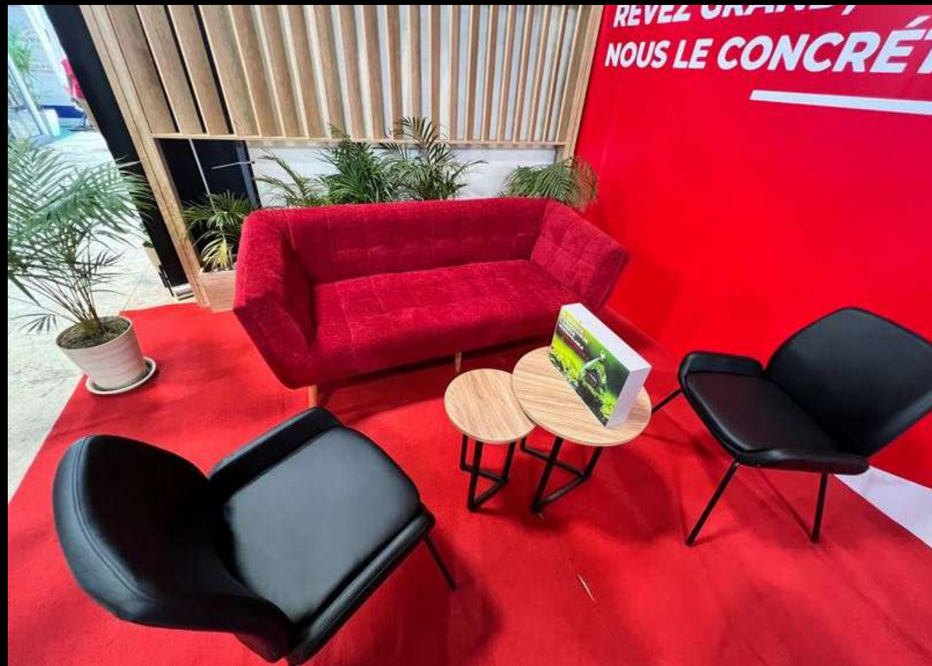
Stand SG-Mada-SIH 2024