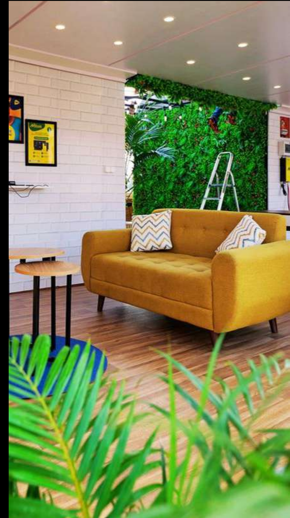
YAS - FIA CCI Ivato 2025