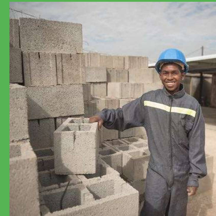
Stock de +2000 hourdis disponible de suite