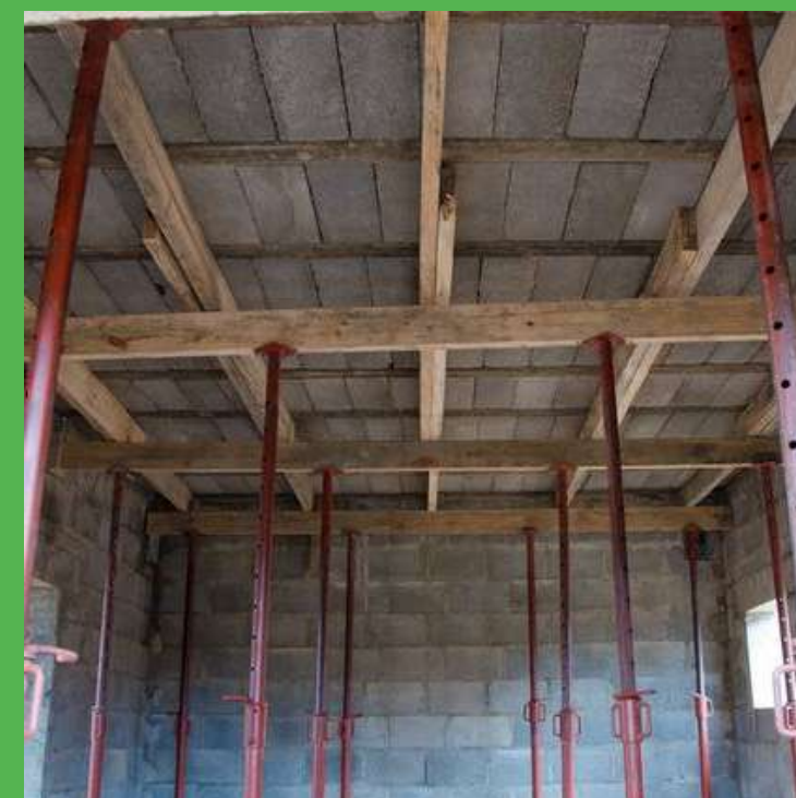
Etayage pour supporter la structure