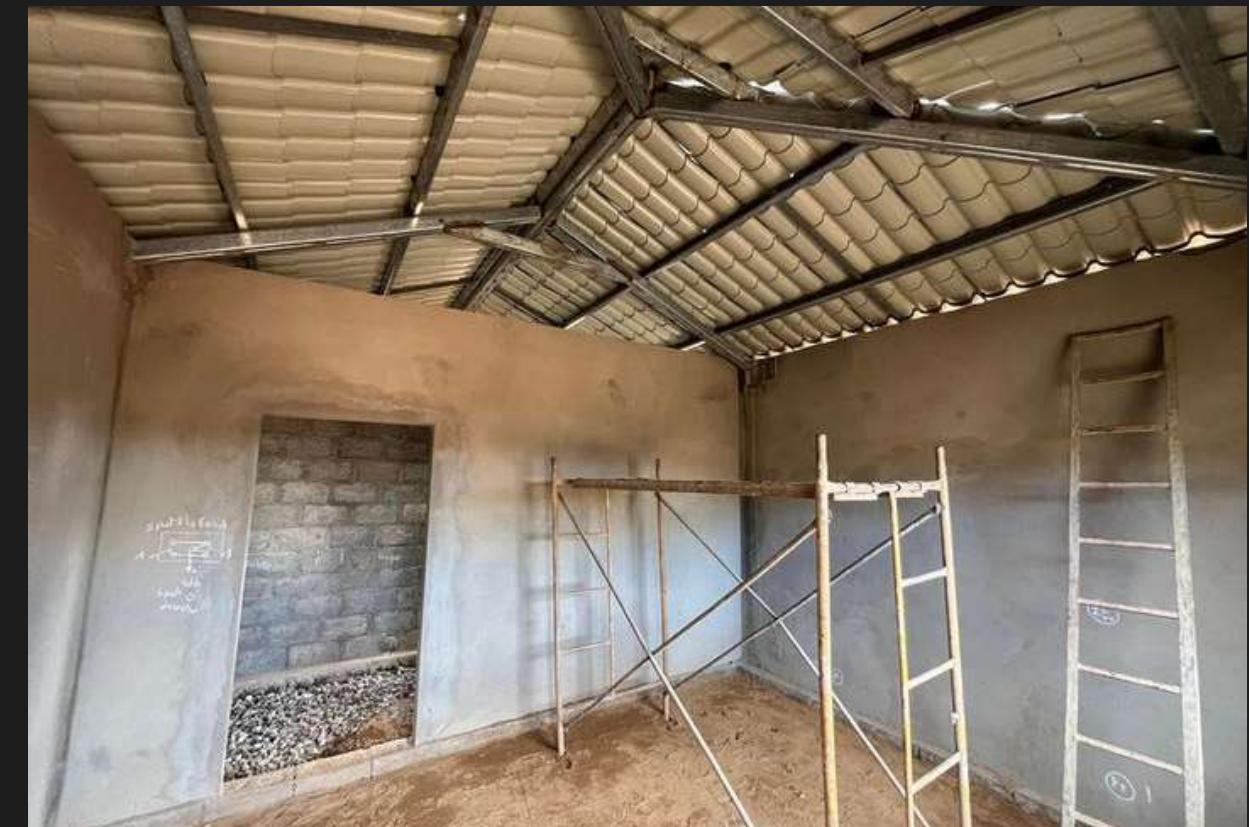
Construction villa clé en main - Panoramique Ambatobe