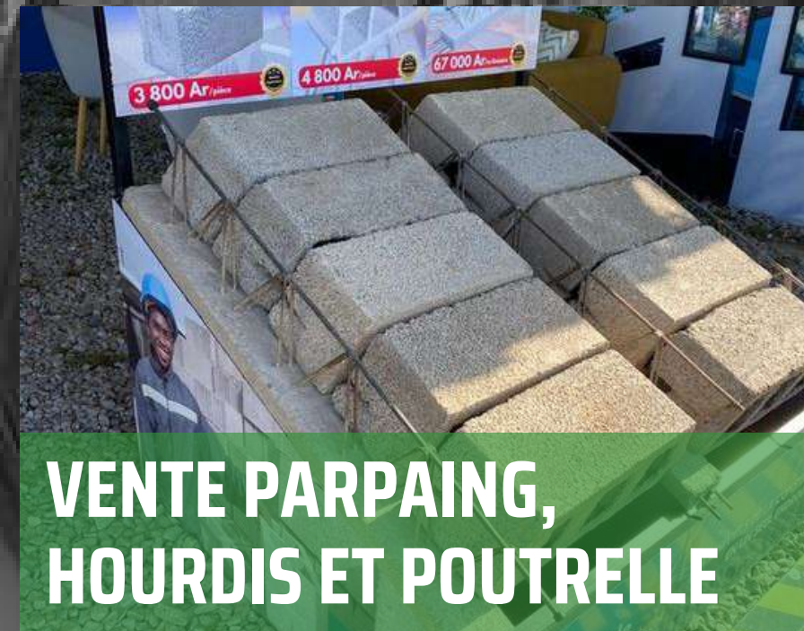
VENTE PARPAING, HOURDIS ET POUTRELLE